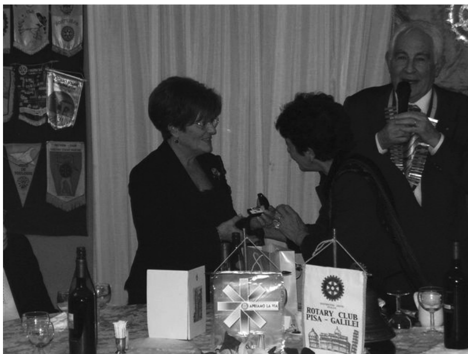
Scambio di omaggi fra le Signore sotto lo sguardo del Governatore