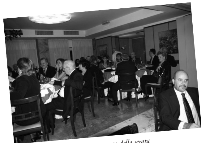
Un altro momento della serata