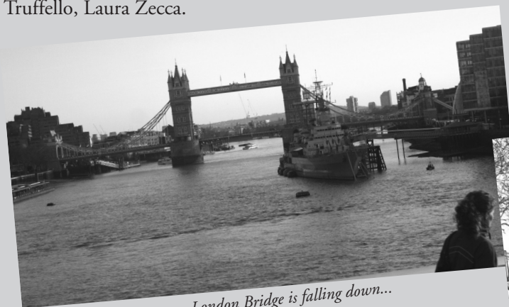
London Bridge is falling down...