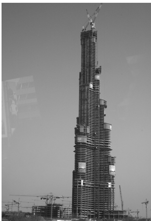
Il grattacielo più alto del mondo