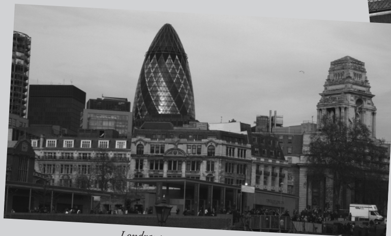
Londra: passato, presente e futuro