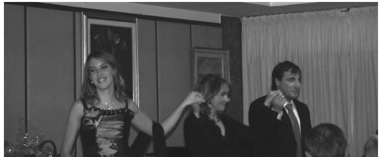
I protagonisti del Concerto