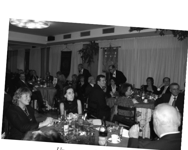
Un momento della serata