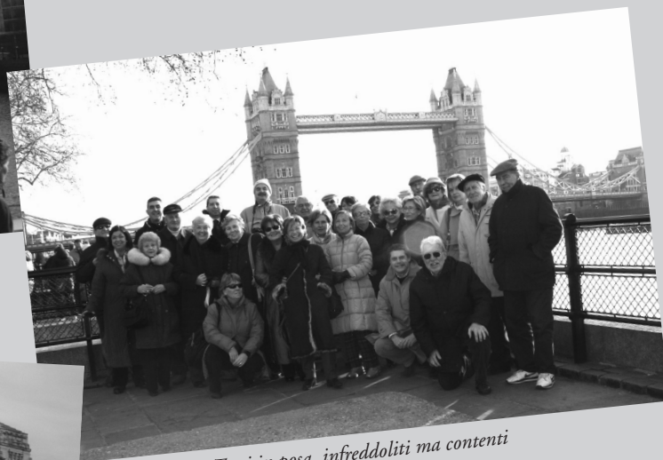
Tutti in posa, infreddoliti ma contenti